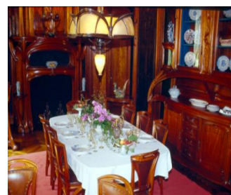
Musée de l'école de Nancy

Enfin, Nancy possède une promenade, dessinée au XVIIe (le cours Léopold) et un jardin botanique, aménagé en 1752 par le roi Stanislas.